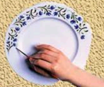
Peinture sur porcelaine